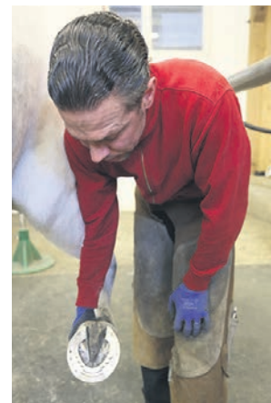
Anpassung des WTS-Hufeisens: Die Arbeitsschritte zielen darauf ab, dass das Hufeisen exakt zentral unter dem Hufgelenksdrehpunkt liegt.